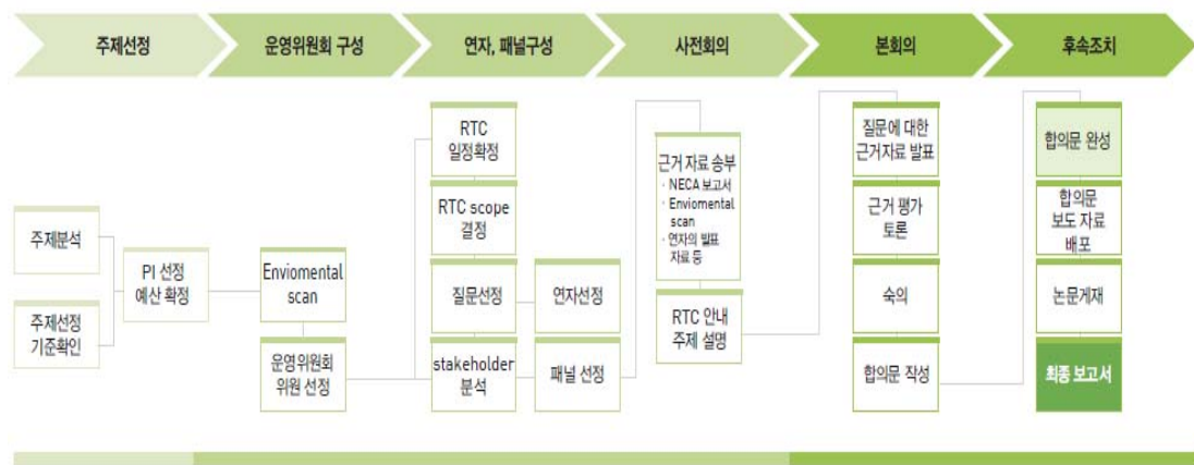
그림 2. NECA원탁회의의 운영절차

‘NECA원탁회의’란 사회적으로 관심 있는 주제에 대해 각계 전문가들을 포함한 다양한 사회구성원들이 참여하여, 한국보건의료연구원(National Evidence-based Collaborating Agency, 이하 NECA)이 지원하는 객관적이고 체계적인 정보를 바탕으로, 핵심 쟁점들에 대해 논의하고 합의점을 모색해가는 공론의 장을 지칭하며, 주제선정, 운영위원회 구성, 연자 및 패널 구성, 사전회의, 본회의 등의 과정을 거쳐 진행된다(그림 2).