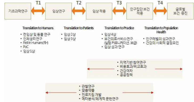
자료: ㈜테크노베이션파트너스, 근거창출임상연구 성과물의 효과분석 및 연구성과 활용체계 연구(2015)